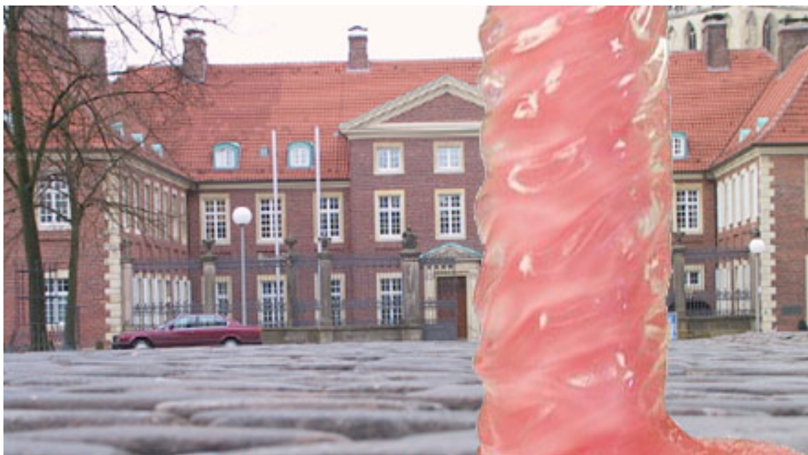
Abb. 4. Projektdarstellung mit der Aussicht auf das Verwaltungsgebäude des Bischöflichen Generalvikariates, Domplatz 27.

Abb. 1. Penisansicht von hinten. Abb. 2. Frontalansicht. Abb. 3. Seitenansicht.