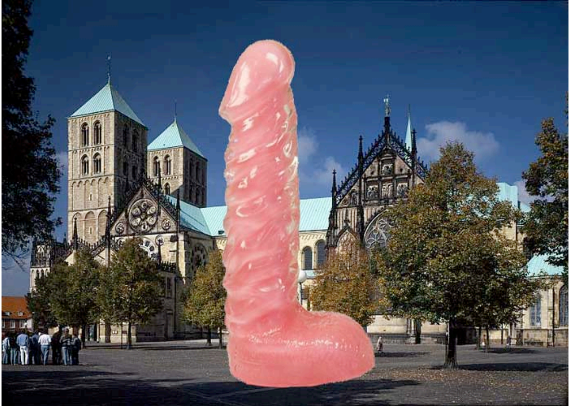
Abb. 5. Darstellung mit dem Dom von Münster im Hintergrund.